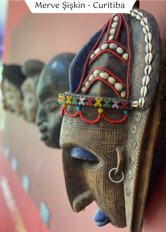
Merve ŐiŐkin - Curitiba