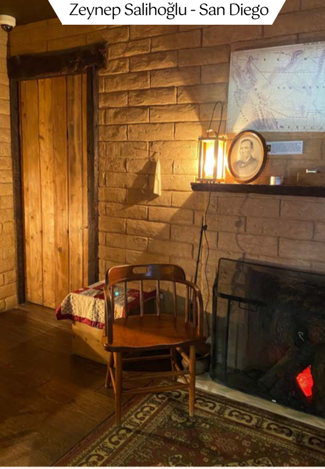
Zeynep Salihođlu - San Diego